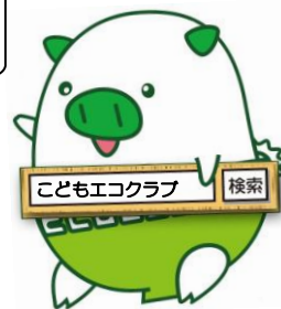
福岡県広報部長 エコトン

※「継続届」は、こどもエコクラブウェブサイトでもダウンロードすることができます。